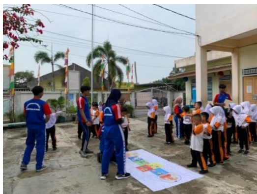
Gambar 2. Permainan Edukatif Engklek Questions

Perencanaan selanjutnya yaitu mendapatkan ijin Kepala Sekolah SD Plus Ditawijaya. Hal ini dilakukan melalui komunikasi yang lancar oleh tim pengabdian masyarakat.