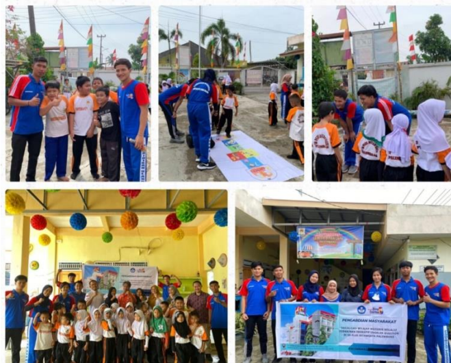
Gambar 3. Pelaksanaan Pengabdian Masyarakat di SD Plus Ditawijaya